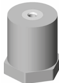
Isolator PW 50 M10