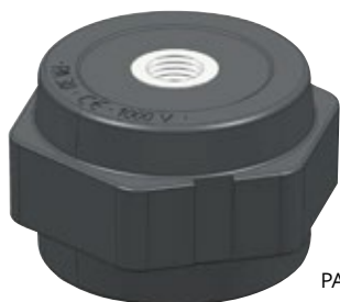
PA 30 M8 PA 30 M10

Die Stützisolatoren PROFIX PA sind vor allem zur Montage und zur festen Befestigung der Sammelschienensysteme, Sammelschienen, Klemmenleisten, Kabelableitungen, der stromführenden Teile der Geräte und anderer elektrotechnischen Anlagen bestimmt.