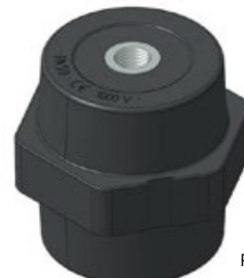
PA 50 M8 PA 50 M10 PA 50 M12