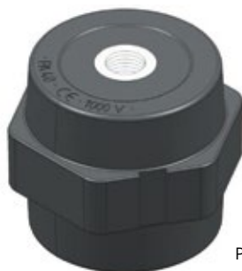
PA 40 M8 PA 40 M10 PA 40 M12